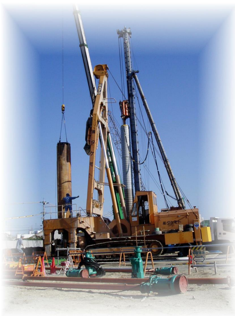
ディープウェル設置工（H17 露橋下水処理場建設工事より）